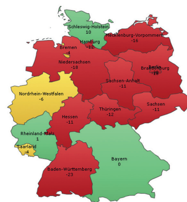
Abbildung: Ansicht Dashboard & Detailansicht mit Darstellung der prozentualen Umsatzentwicklung